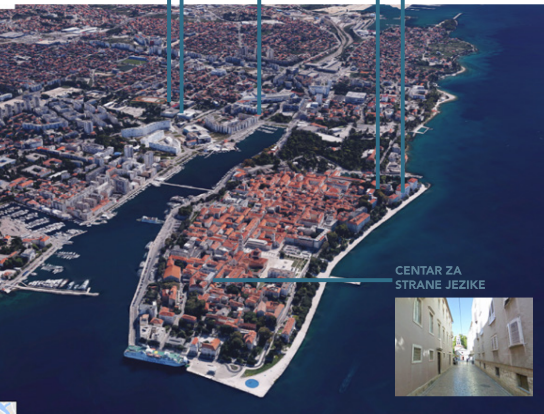
CENTAR ZA STRANE JEZIKE