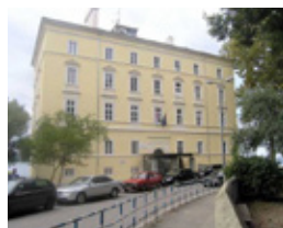
REKTORAT STARI KAMPUS SVEUČILIŠNA KNJIŽARA