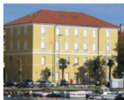
ZNANSTVENI CENTAR CENTAR ZA TJELOVJEŽBU