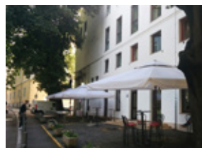
STUDENSKI RESTORANI STUDENSKA REFERADA